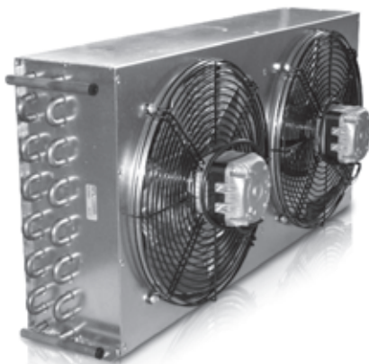
Motorfan data / Данные вентилятора 230V/1/50 Hz