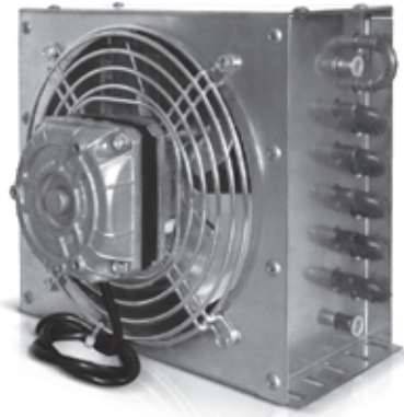
Motorfan data / Данные вентилятора 230V/1/50Hz